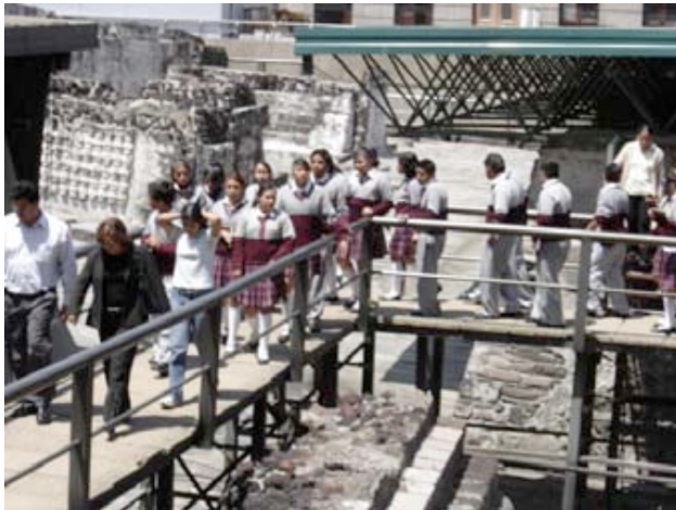
Fig. 1 Visitantes en la zona arqueológica del Templo Mayor durante el estudio de público. Fotografía Denise Fallena.

Hace algunos años tuve la oportunidad de hacer un estudio de público en la zona arqueológica y el museo de sitio del Templo Mayor. El estudio consistió en observar las percepciones durante la visita guiada a cargo del personal del museo. 1