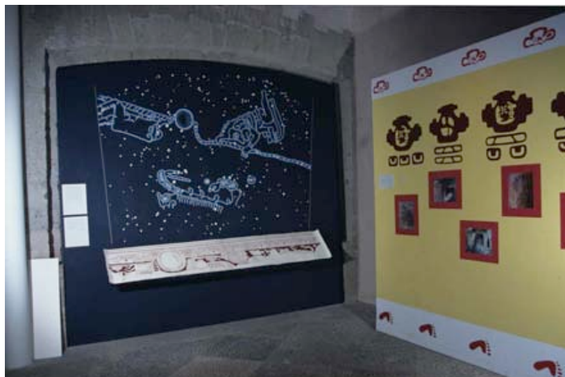
Fig.4 Muestra gráfica de la exposición de 1996 en Colegio Nacional.