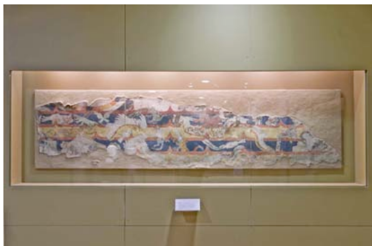
Fig.9 Fragmento mural teotihuacano en la exposición Teotihuacán. Ciudad de los Dioses en el Museo Nacional de Antropología.