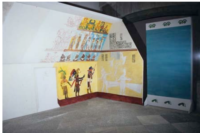
Fig.5 Reconstrucción sobre técnicas y materiales.

Un gran logro por difundir la pintura mural prehispánica fue la exposición Fragmentos del pasado exhibida en el antiguo Colegio de San Ildefonso y que después viajó a Girona y Macao. Esta exposición, donde se mostraron más de 360 piezas, se dedicó a la pintura mural desde un aspecto interdisciplinario. 9 Se pudieron reunir piezas de varios museos como del Palacio de Cantón en Mérida, del Museo de sitio y las bodegas de la Zona arqueológica de Teotihuacan y del Museo Nacional de Antropología, también del Museo de Jalapa, Veracruz, del Baluarte de San Miguel de Campeche, del Museo Amparo de Puebla, del Museo Bristol en Inglaterra y del Museo de Nápoles. 10 Una propuesta museográfica muy didáctica y atractiva fue la reproducción arquitectónica de la Tumba 105 de Suchilquitongo en Oaxaca. Para esta reproducción se usaron fotografías a escala