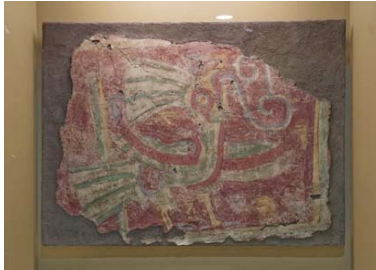
Fig.7 Fragmento mural teotihuacano en la exposición Teotihuacán. Ciudad de los Dioses en el Museo Nacional de Antropología.