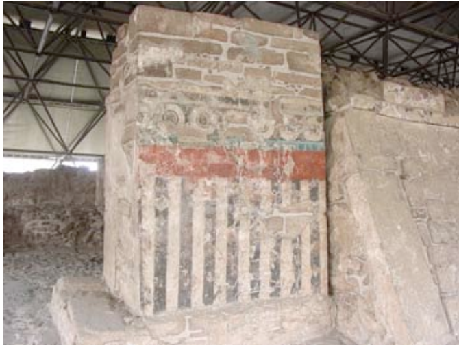
Fig. 3 Mural del adoratorio de Tlaloc, etapa II.

También observé que casi ningún visitante se percataba de los murales que aún se conservan en los adoratorios de la etapa constructiva II, tampoco los guías hacían hincapié sobre ellos, de tal manera que quedaban completamente desapercibidos.